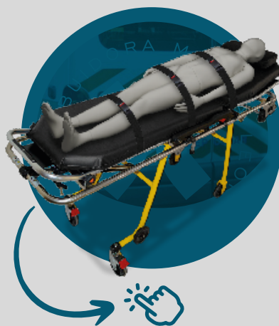
Cinturón para Camilla de ambulancia S-04

Haz clic en la imagen correspondiente para acceder a la ficha técnica y conocer las características de cada producto.