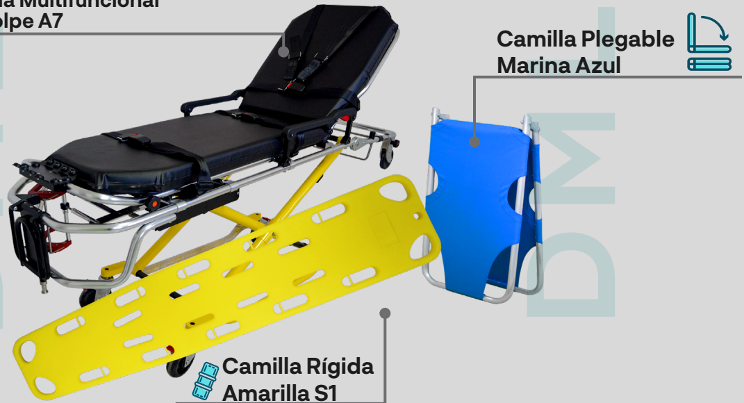
Camilla Rígida Amarilla S1

Haz clic en la imagen correspondiente para acceder a la ficha técnica y conocer las características de cada producto.