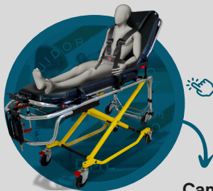
Camilla Multifuncional de Golpe A7

Haz clic en la imagen correspondiente para acceder a la ficha técnica y conocer las características de cada producto.