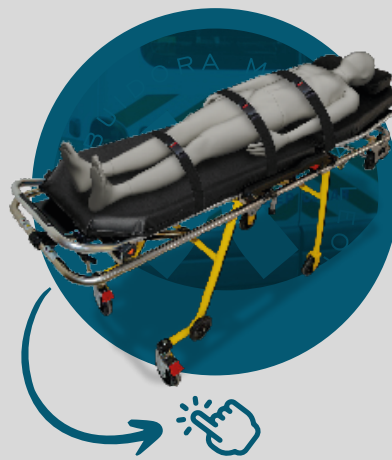
Cinturón para Camilla de ambulancia S-04

Haz clic en la imagen correspondiente para acceder a la ficha técnica y conocer las características de cada producto.