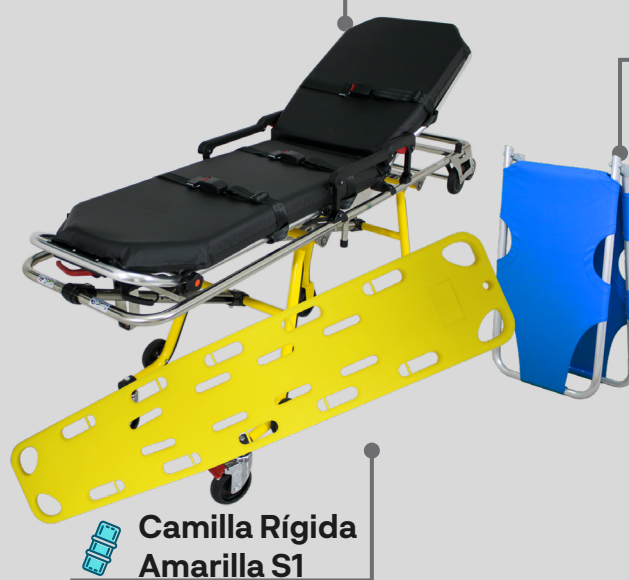
Camilla Rígida Amarilla S1

Haz clic en la imagen correspondiente para acceder a la ficha técnica y conocer las características de cada producto.