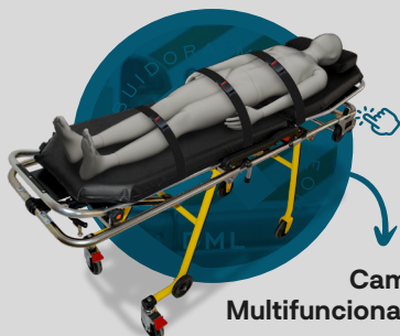
Camilla Multifuncional de Golpe A8

Haz clic en la imagen correspondiente para acceder a la ficha técnica y conocer las características de cada producto.