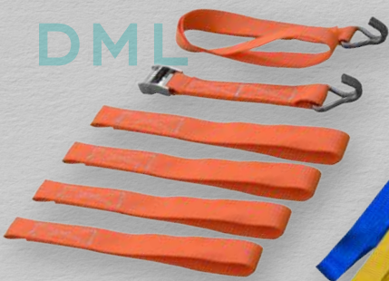
Eslinga/Arnés para traslado aéreo.