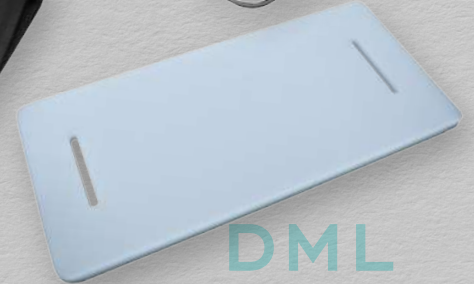
Tablero de sujeción de pies ajustable